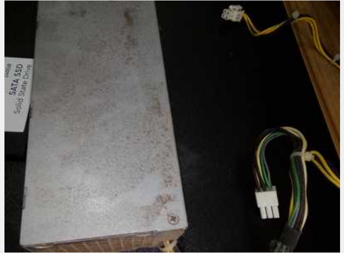
Fuente de poder