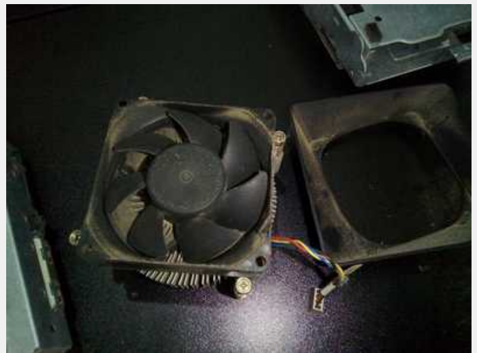
Disipador y ventilador