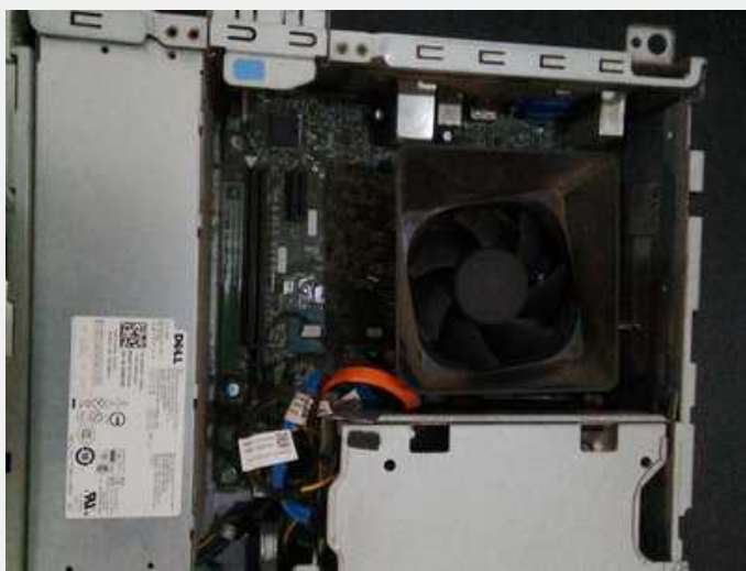
Pc sin tapa