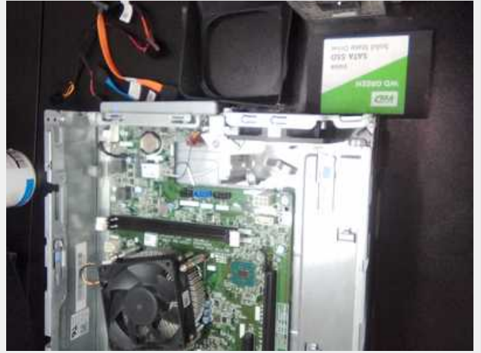
Equipo finalizando y limpieza exterior