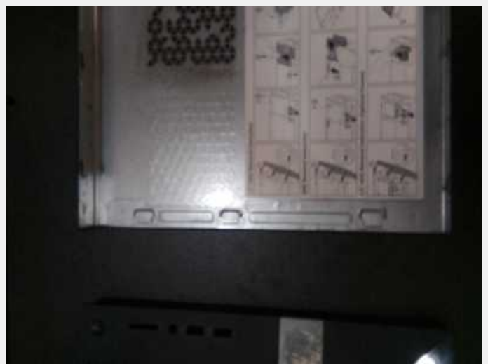
Plástico frontal y tapa