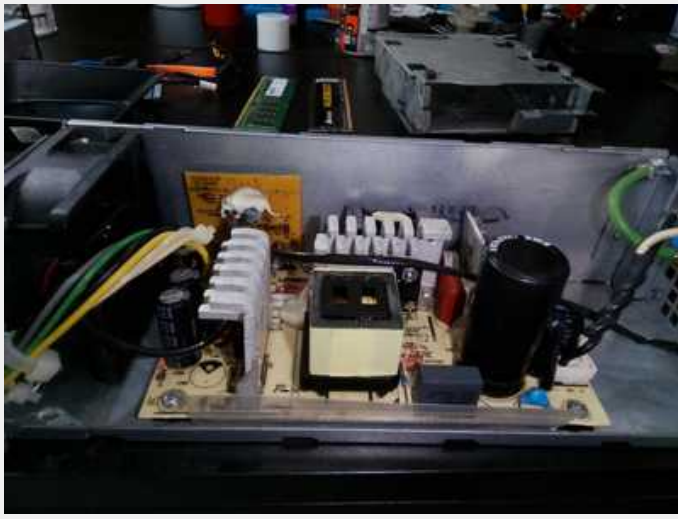
Equipo listo para ensamblar